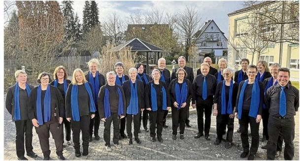
Richtete 2024 den Kreissängertag aus: der Gemischte Chor Neuerode. Und auch in diesem Jahr stehen Konzerte und Gemeinsinn auf dem Programm.