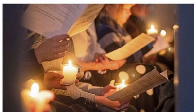
Ostergottesdienst SYMBOLD FOTO: CHRISTIAN SCHAUDERNA

Osternmontag, 21. April Jestädt: 11 Uhr Meinhard-Gottesdienst